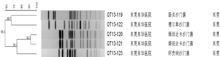
图2 鸡源沙门菌的聚类分析图

均在 58.3% ~ 74.1% 之间,对菌株间的相似性进行比较,显示未发现关联,见图 2。